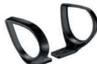
Brazos JACK. Fijos. Color negro.