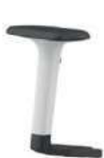
Brazos 1D. 1D Regulables en altura. Color blanco-negro.