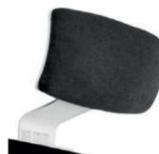
Apoya cabezas regulable tapizado.