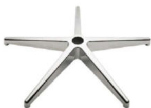
Base giratoria de aluminio pulido.