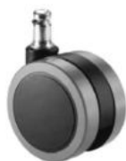
Juego de ruedas (5) de rodadura blanda de Ø65 mm.