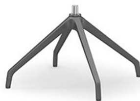
Base giratoria de 4 radios, mod. SWISS negra