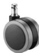
Juego de ruedas (5) de rodadura blanda de Ø65 mm.