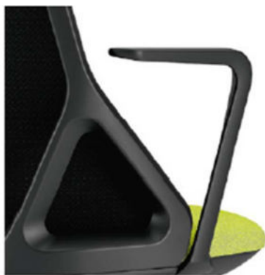
Brazos Mabel negros